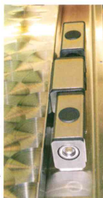
massive Edelstahl-Bänder, steigend und justierbar